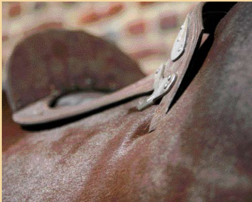
Aan de boom van dit ontklede zadel kun je goed zien dat het te klein is, de houten boom drukt in de schoft.