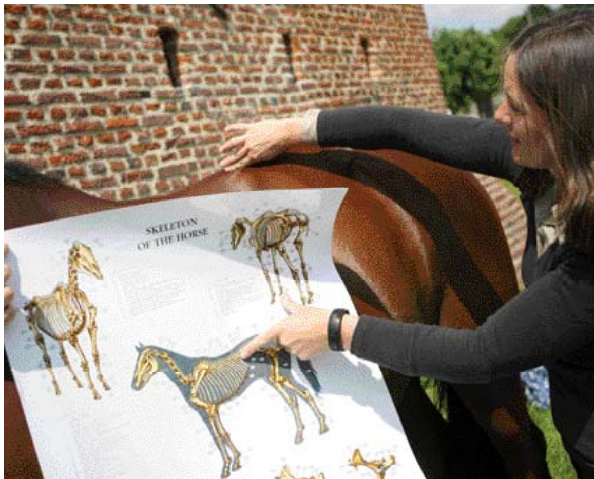
Het zadel mag niet te lang zijn. Het mag niet voorbij de achttiende rib komen.