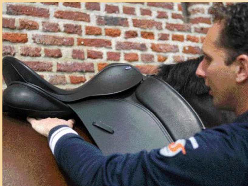
Je moet goed voelen of een zadel mooi aansluit en niet drukt of juist 'brugt'.