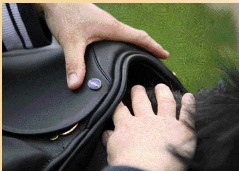
Ook moet gekeken worden of het zadel niet over de schoft heenvalt, zoals op deze foto.