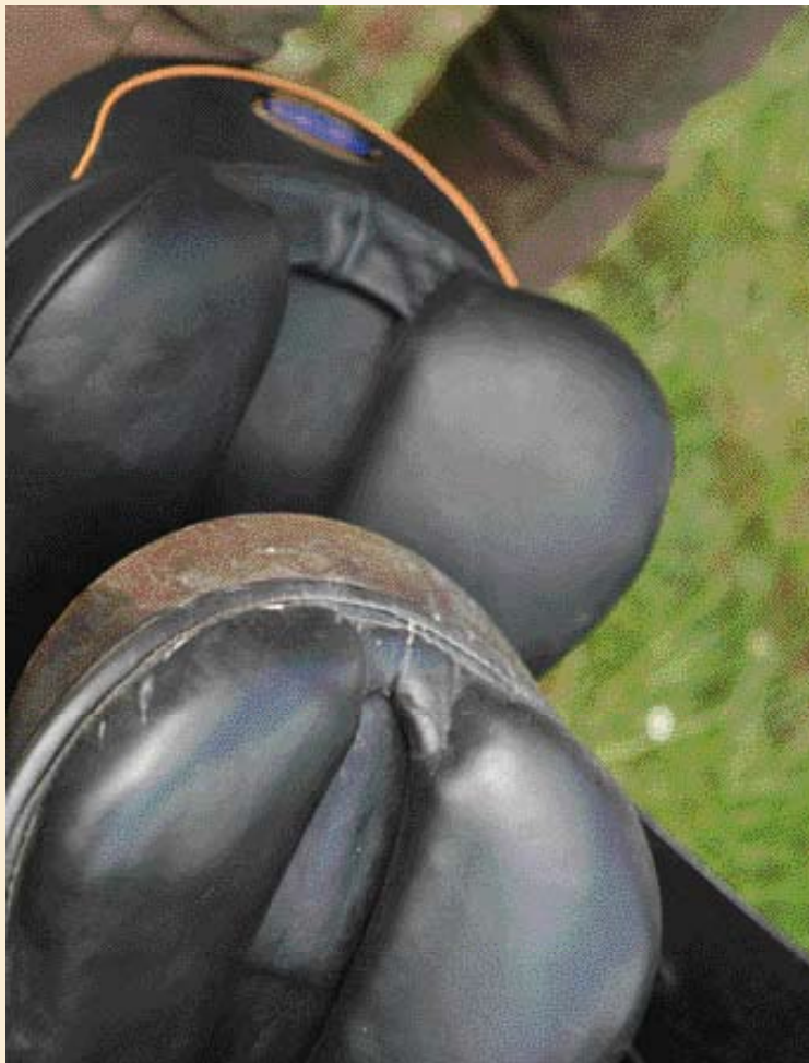
Door veelvuldig opvullen is de ruimte tussen de twee kussen bij het oude kussen te nauw geworden. Dit geeft de ruggenwervels onvoldoende bewegingsvrijheid.