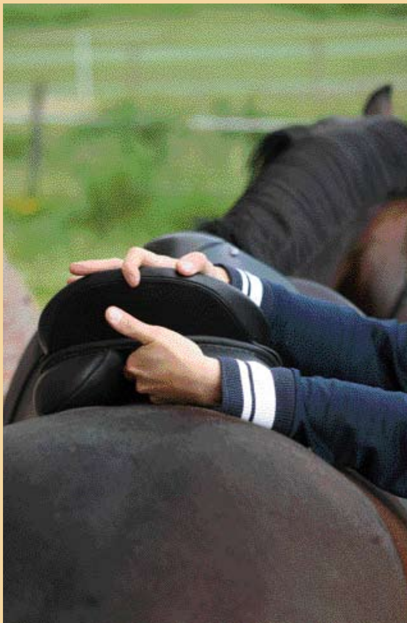
De ruimte tussen de twee kussens moet minimaal drie vingers breed zijn.