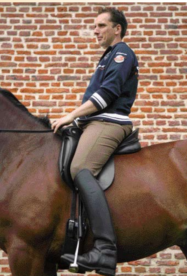
De ruiter moet niet vergeten ook zelf het zadel uit te proberen. Ook hij moet lekker zitten en niet het gevoel hebben dat hij naar voren of achteren helt.